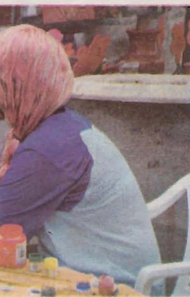
...nturas no rosto e

O encerramento da Semana Nacional da Pessoa com Deficiência Intelectual e Múltipla será na sexta-feira, 27, com a 3ª Caminhada pelos Direitos da Pessoa com Deficiência, às 10 horas, na Praça do Mitre.